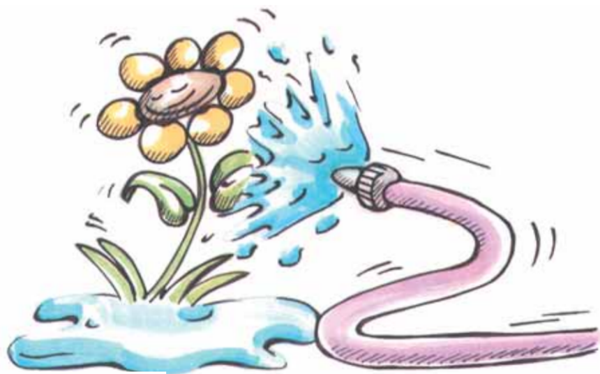
Garten/Sonstiges 8 Liter