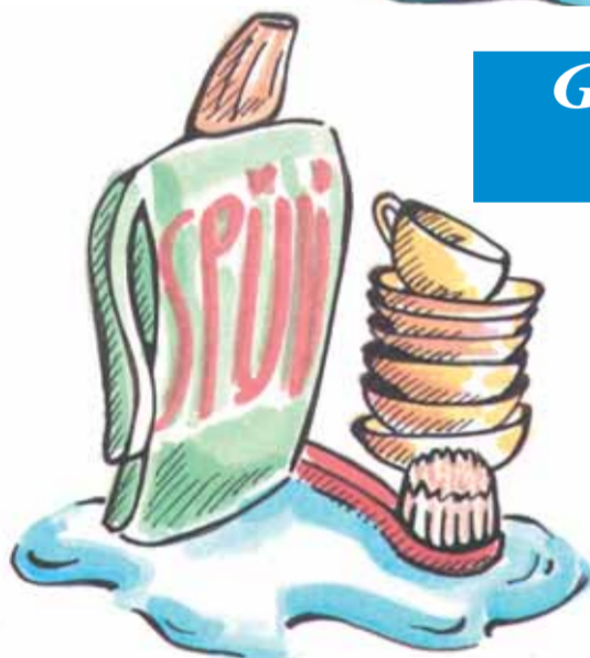
Geschirrspülen 5 Liter