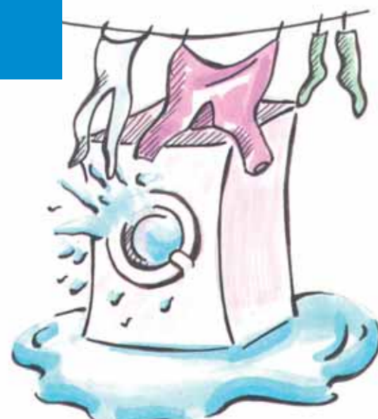
Wäsche waschen 15 Liter