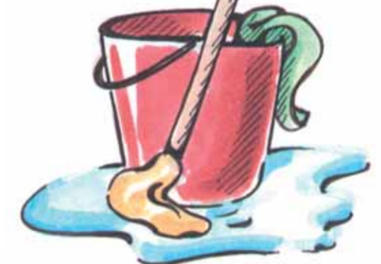
Putzen/Reinigen 5 Liter