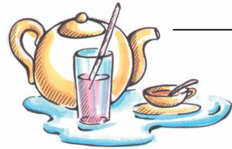
Trinken/Kochen 4 Liter